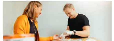
Fysieke test op locatie en adviesgesprek

Gebaseerd op de resultaten ontvangt de medewerker gepersonaliseerd advies om aan de slag te gaan met de vitaliteit. Ook wanneer iemand geen risicoprofiel heeft. Zo zetten we écht in op preventie. Om de vitaliteit van medewerkers duurzaam te veranderen is het mogelijk om medewerkers gepersonaliseerde interventies te bieden.