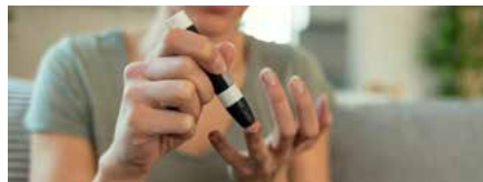
Thuisstestpakket en een online adviesgesprek